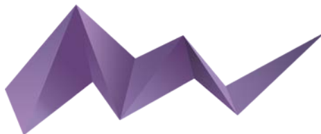
Менеджмент Будущего '19